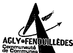
Tableau Annuel d'Avancement au Grade D'Adjoint technique principal 2 ème classe ARRETE N°51/2021