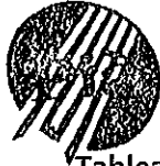
Tableau annuel d'avancement au grade d'Animateur principal 1ère classe N°135