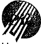
Tableau annuel d'avancement au grade de Adjoint Administratif Principal 2ème classe N°139