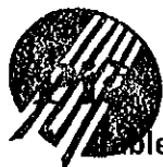
Tableau annuel d'avancement au grade de Technicien Principal 1 ère classe MAIRIE de PIA N°136