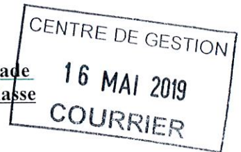
Tableau Annuel d'avancement au grade d'Adjoint Technique Principal 1ère Classe

Le Premier Adjoint de la Commune de Bolquère, Vu le Code Général des Collectivités Territoriales, Vu la loi n° 83-634 du 13 juillet 1983 modifiée, portant droits et obligations des fonctionnaires, notamment son article 17, Vu la loi n° 84-53 du 26 janvier 1984 modifiée, portant dispositions statutaires relatives à la Fonction Publique Territoriale, notamment ses articles 79 et 80, Vu le décret n° 2006-1690 portant statut particulier des agents de catégorie C et notamment du cadre d'emploi de "Adjoint Technique Principal 1ère Classe" Considérant l'Avis de la Commission Administrative Paritaire du 28/01/2019,